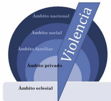
Diagrama que muestra cómo la violencia puede atravesar todos los ámbitos de la vida (© Christof Sauer, IIRF)

La violencia se define como la privación de la libertad física o daño corporal o mental grave hacia los cristianos o, un daño grave a sus propiedades, y puede ocurrir en todos los ámbitos de la vida – como se ilustra en el diagrama que sigue: