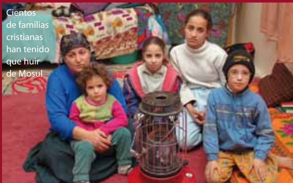
Cientos de familias cristianas han tenido que huir de Mosul

bien murieron algunos cristianos. Desde entonces, cientos de cristianos están tratando de salir de la ciudad, pero es muy difícil. Las autoridades locales animan a los cristianos a buscar refugio en otra ciudad, afirman que no pueden garantizar su seguridad. (OD)