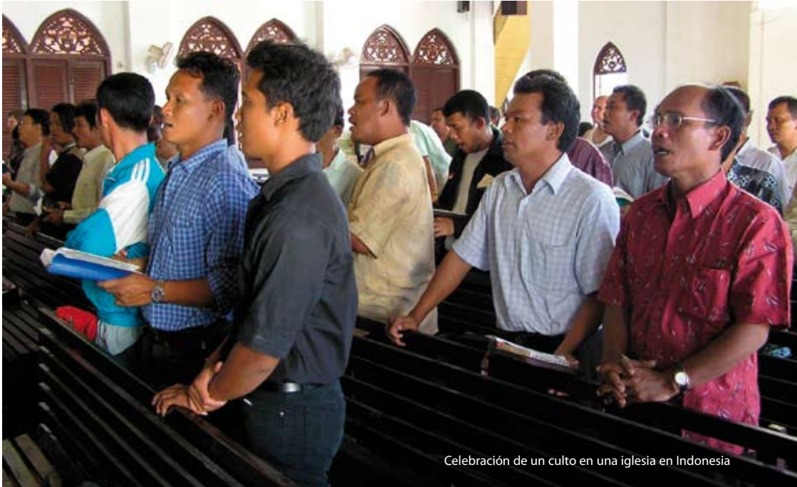
Celebración de un culto en una iglesia en Indonesia

Durante el mandato del actual presidente Yudhoyono, que comenzó en octubre de 2004, ochenta y siete iglesias han sido clausuradas por presiones de grupos extremistas musulmanes, según informa la organización musulmana moderada "El Instituto Wahid", en colaboración con un número importante de instituciones cristianas y el comité de derechos humanos indonesio. Según esta organización de derechos humanos, la violencia contra las iglesias, se concentra primordialmente en las provincias del oeste y el centro de Java, Banten, el sur de Sulawesi y Bengkulu (en Sumatra) En el periodo en el que ejerció la presidencia su predecesor Megawati Sukarnoputri, fueron des-