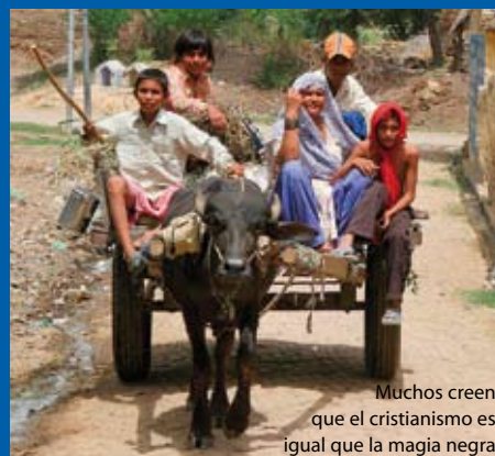
Muchos creen que el cristianismo es igual que la magia negra