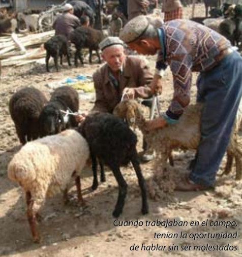
Cuando trabajaban en el campo, tenían la oportunidad de hablar sin ser molestados