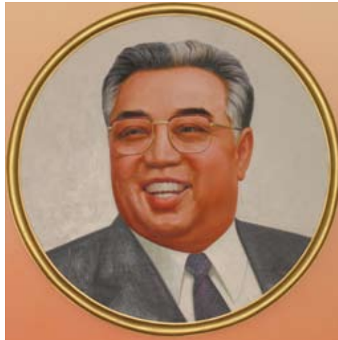
Retrato de Kim Il Sung, "Gran Líder" de Corea del Norte y padre del actual presidente del país, Kim Jong-Il

El islam es la religión mayoritaria en seis de los 10 países: Arabia Saudita, Irán, Maldivas, Afganistán, Yemen y Uzbekistán. Tres países