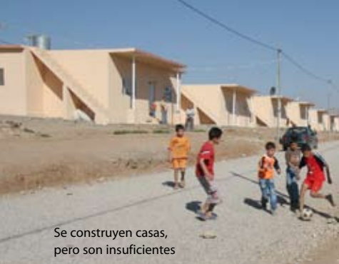
Se construyen casas, pero son insuficientes