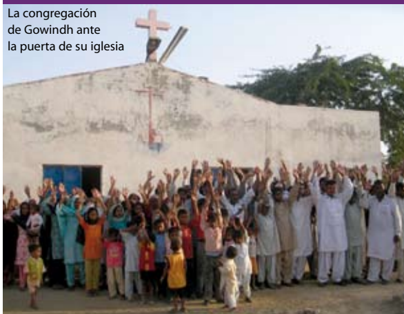
La congregación de Gowindh ante la puerta de su iglesia

8 mezquitas del pueblo, se hizo un llamamiento a la guerra santa contra los cristianos. “Hacedos musulmanes o preparaos para luchar o morir” gritaban los imanes.