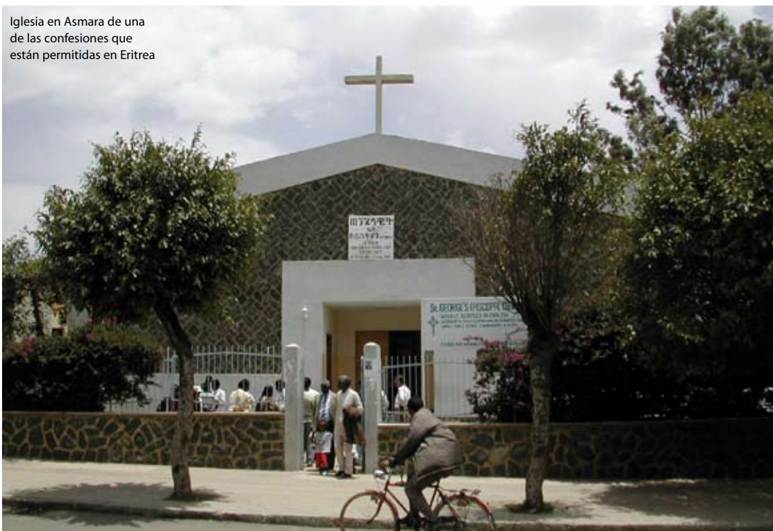
Iglesia en Asmara de una de las confesiones que están permitidas en Eritrea

El 23 de octubre, un grupo de desconocidos prendió fuego a una iglesia en el centro de Jerusalén. Gracias a que los bomberos llegaron a tiempo, los daños no fue demasiado grandes. El edificio es usado por varias congregaciones: una internacional, otra rusa, una tercera bautista y, por último, una de judíos mesiánicos de habla hebrea. (CD)