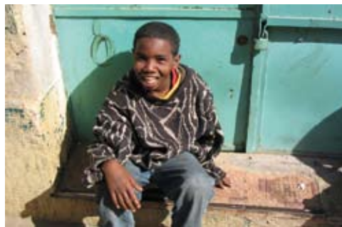
El gobierno eritreo teme perder a la juventud del país

Eritrea.- 1.793 cristianos, 69 musulmanes y 27 testigos de Jehová están encarcelados por motivos religiosos. Alrededor de otras 250