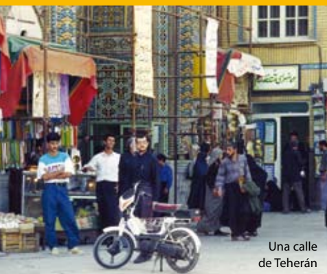
Una calle de Teherán

Los musulmanes que se convierten a Cristo arriesgan sus vidas. Con frecuencia son rechazados por sus familias, pierden sus trabajos, son golpeados y, en algunos casos, son asesinados. A finales del pasado año, el iraní Ghorban Tourani murió acuchillado por convertirse al cristianismo. Aún así, los cristianos que viven en Irán y en el resto de Oriente Medio no se dan por vencidos. Continúan confiando en Dios y contando con nosotros.