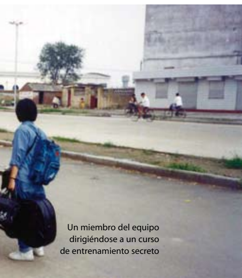
Un miembro del equipo dirigiéndose a un curso de entrenamiento secreto

Vietnam es parte de nuestro programa para el Sudeste de Asia. Nuestros proyectos in-