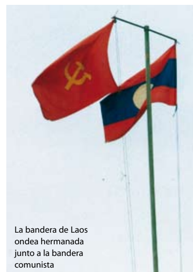
La bandera de Laos ondea hermanada junto a la bandera comunista