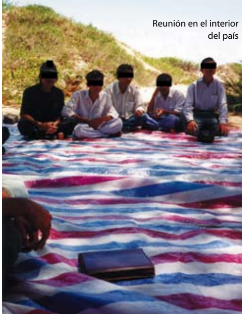
Reunión en el interior del país

Somalia está situada en el cuerno de África, con Yibuti, Etiopía, Eritrea y Kenia como vecinos. Puertas Abiertas puede ayudar a los cristianos de África Oriental en muchas formas. Les proveemos de cosas tan diver-